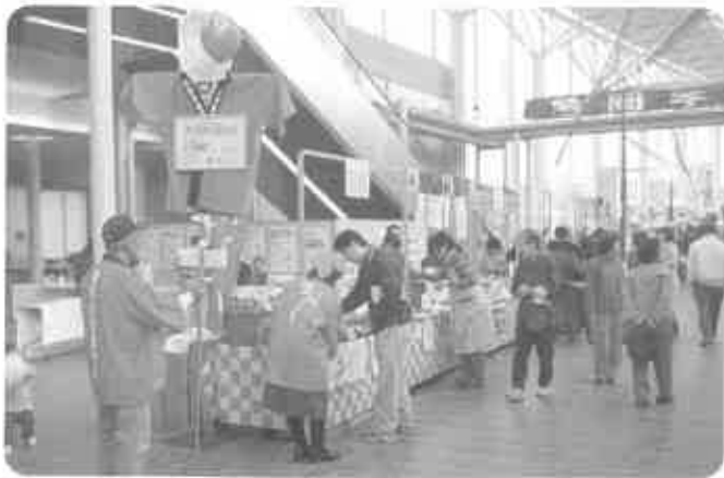
◀ふれあいまつり信号人

空ぐじなしで全員にプレゼント！ 三十名のスタッフで、効率よく抽選会を運営することが出来ました。 協賛いただいた各商店街、各お店の皆様には厚く御礼申し上げます。