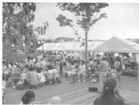
七色公園、人、人、 3千人に感激