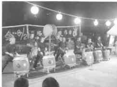
力のこもった 太鼓演奏に酔う

②亀岡駅前商店街(H18年12月～H19年1月) NHK『京一日』で紹介された、クリスマス& ニューイヤーのきれいなイルミネーション