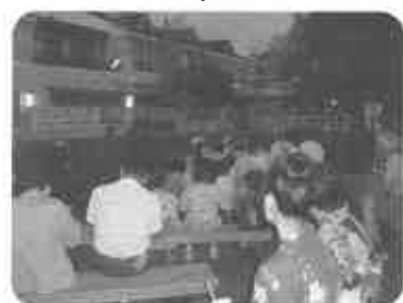
『旧暦の七夕まつり』 ひな流し 天の川とふれあいの城下町