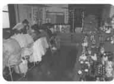
お母さん方の活躍でにぎわい感謝一杯です