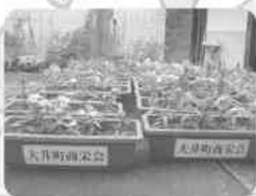
花、灯籠、提灯 夏を飾りました