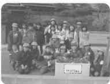
私達の町、僕も私も手伝いました！