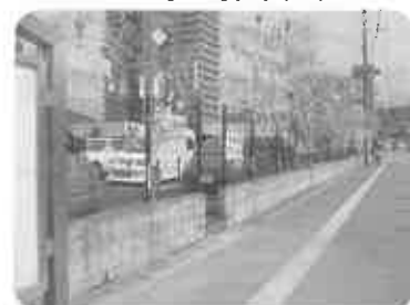
『七夕まつり』 駅前通り観光客のみなさんも参加