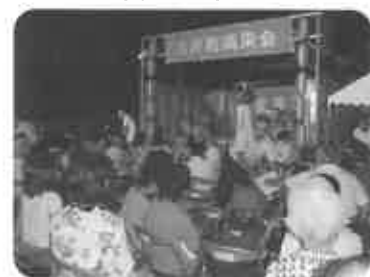
『夏まつり』 灯籠、花、ステージショー 地域の盛り上がり！