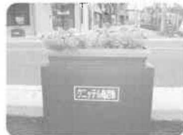
頼政塚から100個の花でフラワーロード完成