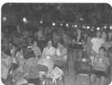
『ふれあい祭』 手づくり屋台もステージもボリューム満点！