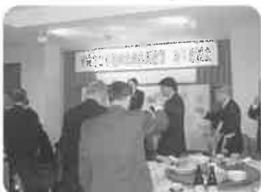
良い年を祈りスタートに乾杯。72名出席