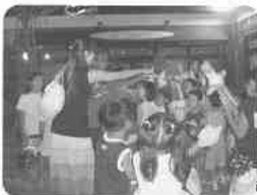
『花の金曜夜市』 500人の人出で大にぎわい