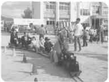
『秋まつり』 ミニSLも400人運びました