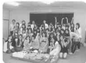
『大井御膳』開発に42名の大学生、協力いただきました