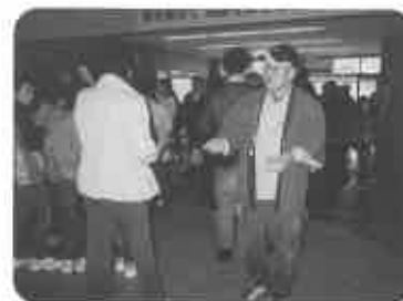
トロッコ嵯峨駅で 春バージョン配布