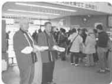
トロッコ嵯峨駅で 秋バージョン配布