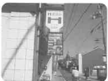
『提灯と行灯とLED街路灯』 ライトアップゆっくりと散策下さい