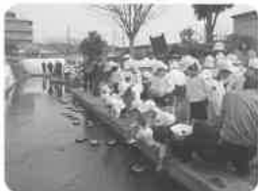
街をあげて、流しびな作って子供達も参加