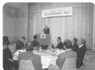
にぎわいと活性化活動、新年度スタートする。47名出席