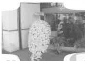
亀岡祭と店頭菊飾り