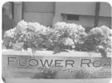
70個のプランターで、街が変わりました