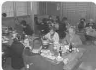
食べて楽しんでいただきました。ごちそうさま！