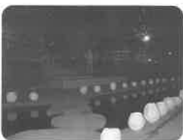
『手づくり行灯』七夕と亀岡祭で活躍