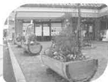
商店街は、花で一杯！