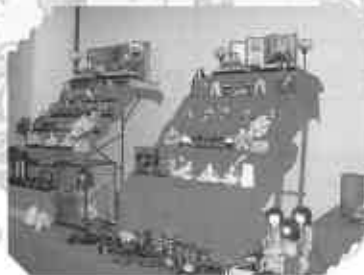
江戸から平成までのお雛さん が店内店頭を飾る(3月3日)