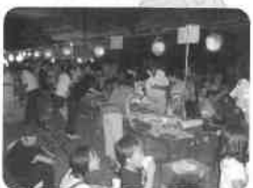
ふれあい祭、大屋台の にぎわい (8月29日)