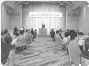
来賓の方々よりお言葉を頂戴 出席55名