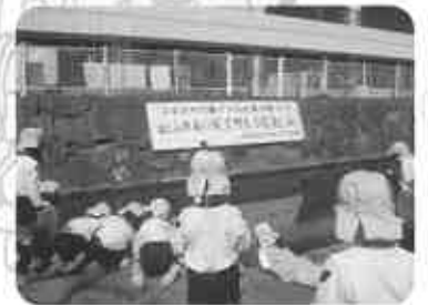
子供達による雛流し (3月23日)