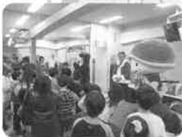
クリスマス大抽選会、 かめまるも参加(12月25日)