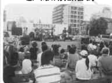
19バンドによる平和音楽祭 2010 (8月7日)