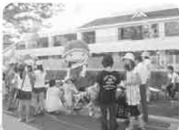
七夕、かめまる君も参加 (8月3日)