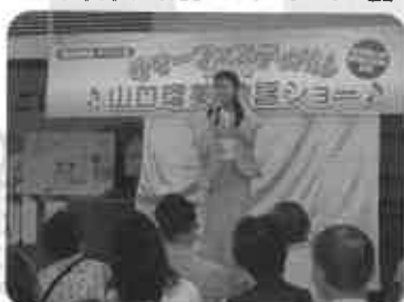
歌謡ショーは大盛況 (8月7日)