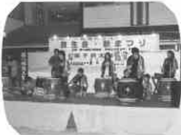
地域の応援、絆も深くなりました (9月19日)