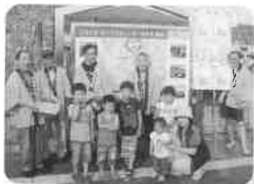
僕達もかめまる君書きました! (7月7日)