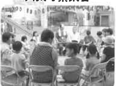
大数珠回しで無病息災祈願 (8月16日)