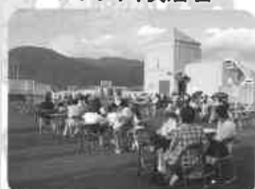
一等地で500人が花火観賞会 (8月7日)