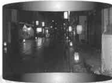
提灯ライトアップ事業 (10月24日)