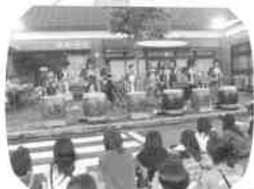
私達も頑張りました (8月6日)