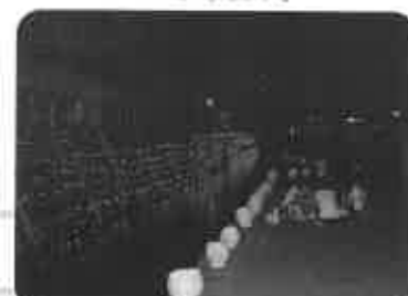
天の川イルミネーション (8月3日)