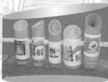
沢山の手づくり灯籠並べました (8月7日)