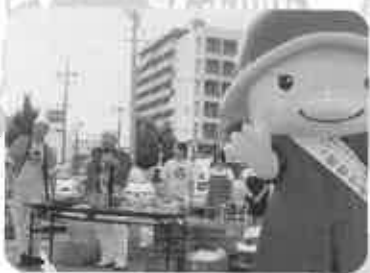
音楽祭チャリティ、かめまるの登場 (8月7日)