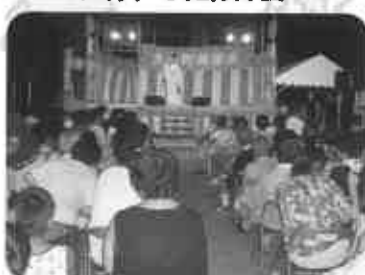
ステージショーは満員御礼 (8月19日)