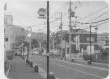
かめまる看板で商店街PR (2月20日)