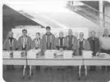
カニツアー抽選会 72組の招待