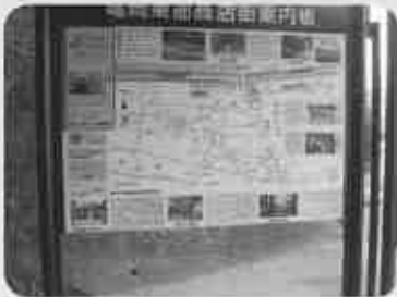
回遊性向上めざし案内板設置 (10月19日)