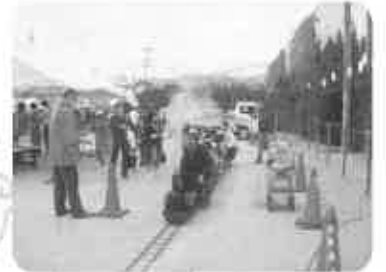
ミニSLは大好評、450人 乗せました(11月14日)