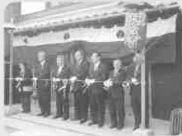
『北町銀座オープン』 テープカット(3月3日)