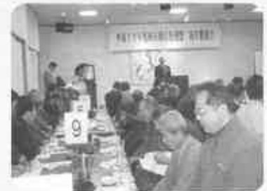
新年の思いを語り合う 70名の盛況